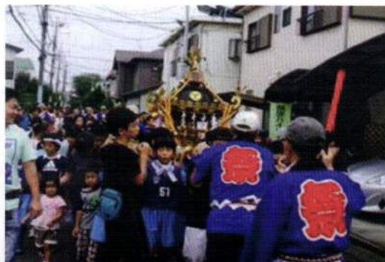
☆杉山神社こども御輿(10月)