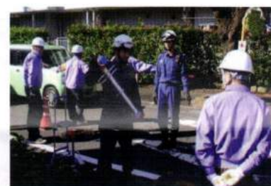
☆合掌苑、防災訓練参加、 スタンプパイプ訓練(11月)