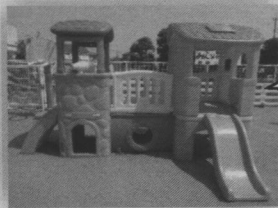
小さなお友だちが楽しめる遊具です