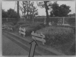
柵は在園児さんの卒園制作です！