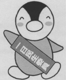
東京都民生委員・児童委員 イメージキャラクター「ミンジー」

2018年は東京都の民生委員誕生から100周年です！ 今後もより多くの方に民生委員・児童委員の活動を知っていただくため、 町田市長に「一日民生委員・児童委員」を委嘱し、 町田駅周辺でPR活動をおこないます。