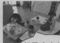
お子さんはそばで遊びながら