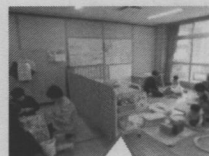
室内開放のお部屋で