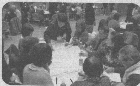
「地域でこんなことができればいいな」 を出しあいました