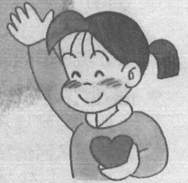
社協イメージキャラクター 「あいちゃん」

町田市社会福祉協議会（町田市社協）は身近な福祉課題について、 地域住民、ボランティアの方々、福祉関係機関等の皆さまとともに 地域で支えあう仕組みづくりに取り組んでいます。