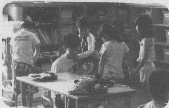
今日はみんなのお兄ちゃんとして大奮闘 夏！体験ボランティア