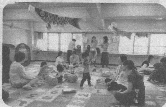
お母さんのおしゃべりの場、ほっとひとときつける場 子育てサロン

地域福祉権利擁護事業、成年後見制度推進事業、福祉サービス苦情調整事業など、福祉に関する様々なご相談をお受けしながら、市民一人ひとりが福祉サービスの利用や契約、財産管理などを適切に行えるようお手伝いしています。