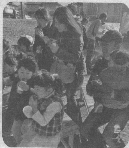
地域みんなでおいしくて楽しいひと時 親子でヤキイモイベント

町田市社協の詳細は https://www.machida-shakyo.or.jp をご覧ください