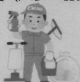
清掃・花壇の管理