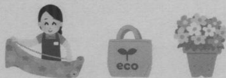
ふきん・バッグ・花などの日用品