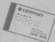
印刷（チラシ・名刺など）