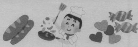
食品（パン・お菓子・お弁当など）