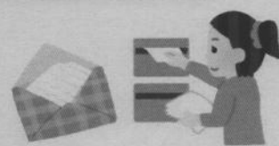
軽作業（封入・ポストイングなど）