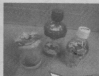
ペットボトル マラカス 鈴おとし