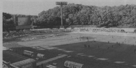
②メインスタンド5階特別席からの眺め