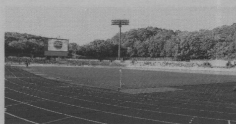
①ピッチサイドのエキサイティングシートからの眺め