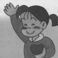
町田市社協イメージキャラクター あいちゃん