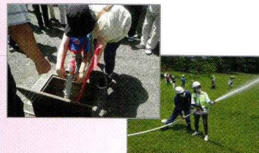
スタンドパイプを使用した放水訓練