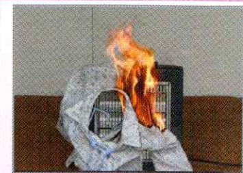
例 電気ストーブに衣類が落下し火出

昨年、町田消防署管内では、火災によりお亡くなりになられた方が4名発生しております。住宅火災をなくすため、皆さま一人一人のご理解とご協力をよろしくお願いいたします。