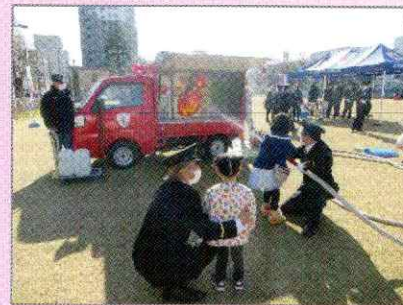
まちかど防災訓練車での放水訓練

引き続き、感染防止対策に配慮した防火防災訓練を実施いたしますので、ご要望があれば、ぜひ一度ご相談ください！