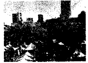
イベントのようす