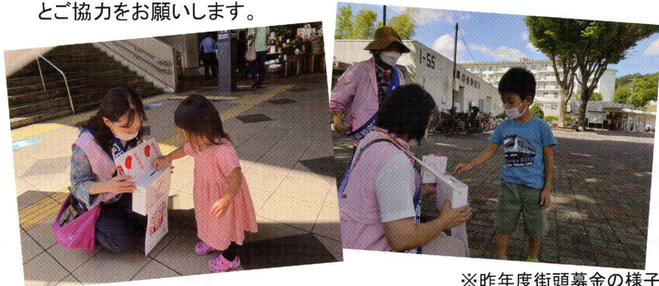
※昨年度街頭募金の様子

皆様からお預かりした募金は、市内の福祉施設や団体等へ配分されます。地域福祉の更なる充実のために赤い羽根共同募金へのご理解とご協力をお願いします。