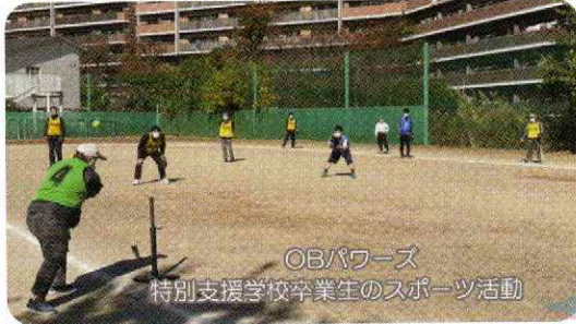
OBパワーズ 特別支援学校卒業生のスポーツ活動