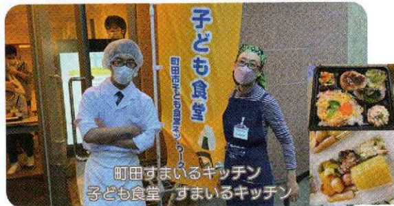
町田すまいるキッチン 子ども食堂 すまいるキッチン 地域の親子が食をとおしてつながる居場所です。

活動するにあたり、助成金により、コロナ対策の道具が多く購入できました。また、休会プランクにより朽ちた用具も購入できました。コロナ禍での活動ができ、感謝しています。