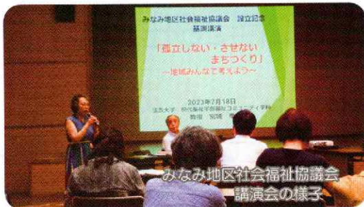
みなみ地区社会福祉協議会 講演会の様子