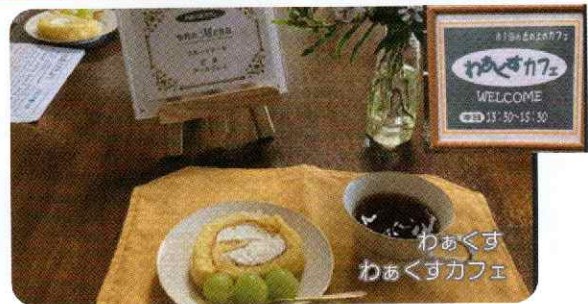
わあくす わあくすカフェ ちょっと一息つけるくつろぎの場です。