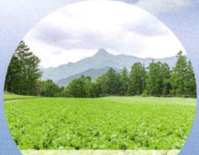
日本一の高原野菜

3～10月／渓流釣り(イワナ、ヤマメ) 5月／川上村山菜まつり 6～11月／登山、ハイキング 7～8月／避暑、川遊び 9～11月／紅葉、きのこ狩り 12～3月／スキー＆スノーボード