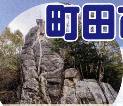
クライミング 小川山・瑞牆山