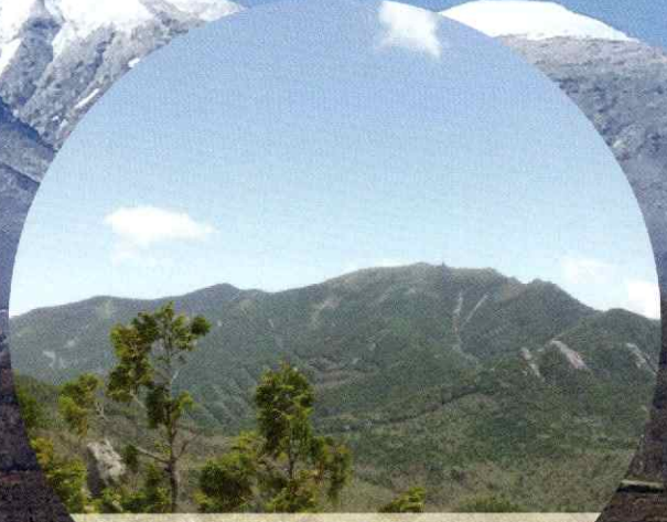
日本百名山 甲武信岳・金峰山 ユネスコエコパーク