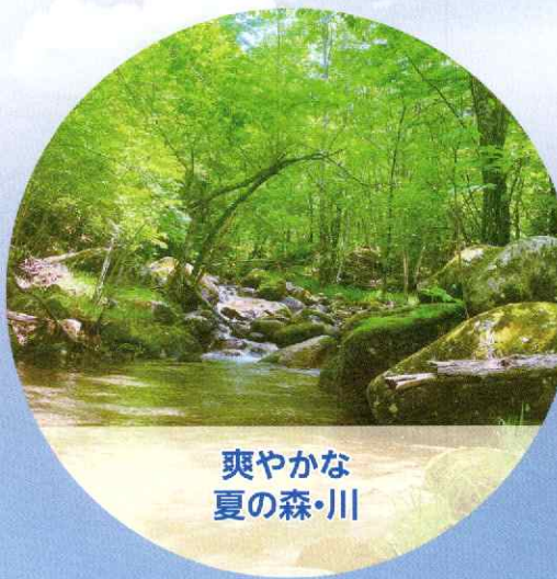
爽やかな 夏の森・川

秩父多摩甲斐国立公園内にあります「星のふるさと」町田市自然休暇村は、標高1,500mで暑さ知らず。周囲は、から松・白樺などの木々に囲まれ、村内には千曲川の支流梓川も流れています。つつじ・しゃくなげなどの咲く春、琥珀色の空の夏、紅葉と静かな星空の秋、雪や霧氷と晴天の多い冬、四季折々の表情で迎えてくれます。